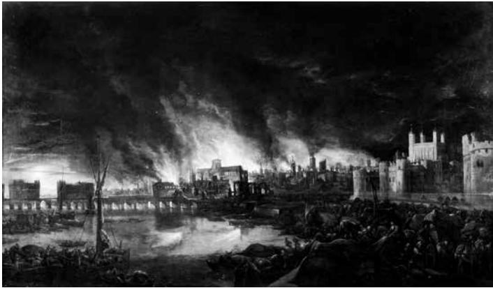
De Grote Brand in Londen, 1675. Schilder onbekend.